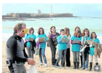
Un grupo de alumnos asisten a los talleres didácticos puestos en marcha por el CAS.

En el fondo, el mar es otro mundo. Matarile, ríle, ríle. Un submundo repleto de historias en las que sumergirse. A las que llegar depende, en multitud de ocasiones, de las fuentes orales y documentales. Retazos del pasado en forma de pecios, ánforas, cerámicas o cañones... que tras siglos de silencio son descubiertos para contar todo lo que han presenciado a lo largo de su sumergida existencia. A veces lo narran desde las cubetas en las que son restauradas, otras son interpretadas in situ . Eso, si logran esquivar el expolio que les acecha. Todo un submundo por descubrir de manera fácil y amena de la mano del Proyecto Sumérgete en la Arqueología Subacuática .