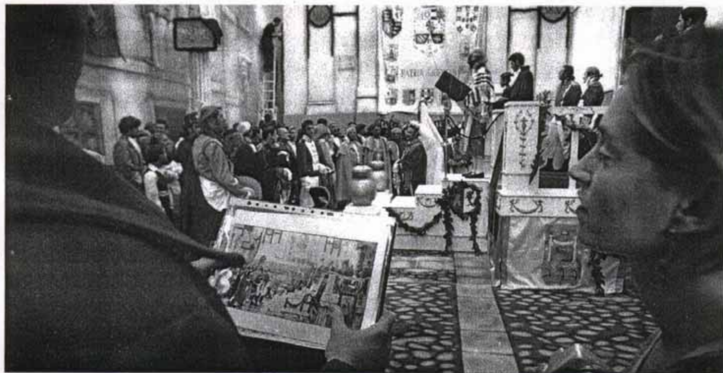
REPÚBLICA. Los actores y figurantes posan a imagen y semejanza de la obra del pintor gaditano para los títulos de crédito de la serie 'El mar de la libertad', producida por Diputación.