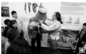
Dos actores de Animarte distraen a un grupo de sexto de Primaria del colegio Tierno Galván, de Chiclana.

Muchas veces, los padres darían lo que fuera por ver a sus hijos en el lugar en el que se encuentran en este momento: en galeras. Se colocan, obedientes, en los extremos de una cubierta de barco trazada en el suelo. El capitán -con uniforme de principios del XIX- y un espontáneo contraмаestre les ordenan ir a estribor. Y todos ellos -maestros incluidos- caminan felizmente hacia proa. Un par de órdenes más y el caos es idéntico al de un patio de colegio.